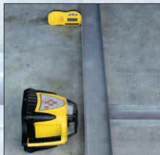
Rugby 200 med Rod-Eye i liggande läge