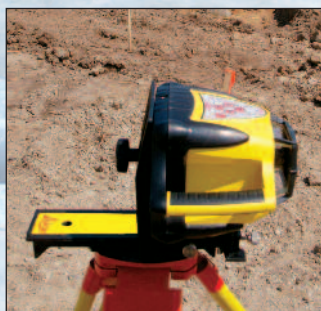
Rugby 200 med hållare